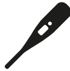
Verhoging of koorts