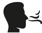
Reuk- en/of smaak- verlies

Heb je op dit moment een huisgenoot met milde klachten en koorts en/of benauwdheid?